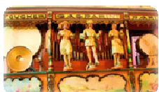
Musée de la musique mécanique