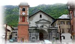
Visite guidée de Moûtiers