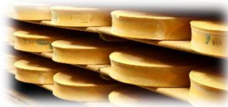
Coopérative laitière de Moûtiers