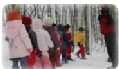
Balade en raquettes