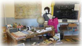
Musée d'Antan de Raclaz